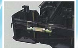
ターンバックル式サイドプレート